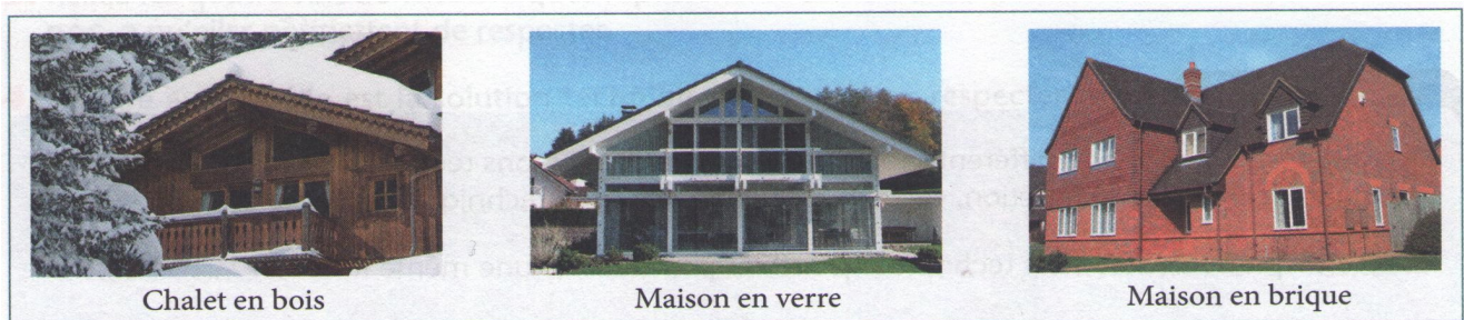
DOC. 2 Des exemples de matériaux disponibles pour fabriquer un mur